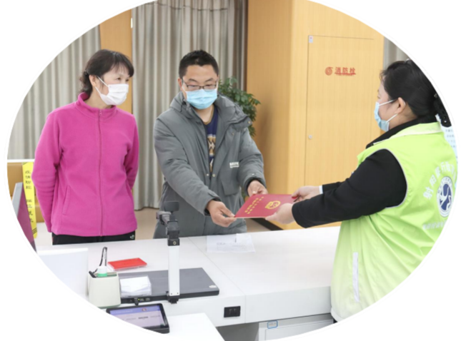
打造了“阳光登·e证达”党建品牌