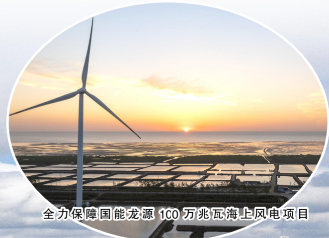
全力保障国能龙源100兆瓦海上风电项目

坚持岸线生态修复。利用慧眼守土、土地执法综合监管平台系统等科技手段，加大全县范围内的土地执法巡查工作，提高违法用地的及时发现率和制止率。开展海域动态巡查和智慧海洋云巡查18次，巡查里程600公里，完成重点项目海域使用动态监测报告。全力保障国能龙源100兆瓦海上风电项目、盐城港射阳港区5万吨航道工程、新洋港闸下移工程、港开区蟹苗养殖基地不动产权证办理等重大项目用海。落实海洋气象预报南通环境监测中心和射阳气象预报发布平台预警发布责任，按时播报射阳县海洋天气预报。建立用海服务工作群发预警信息101条。常态化开展海洋预警防灾减灾工作，加大海洋灾害隐患排查动态巡查力度，开展海洋预警监测巡查14次。