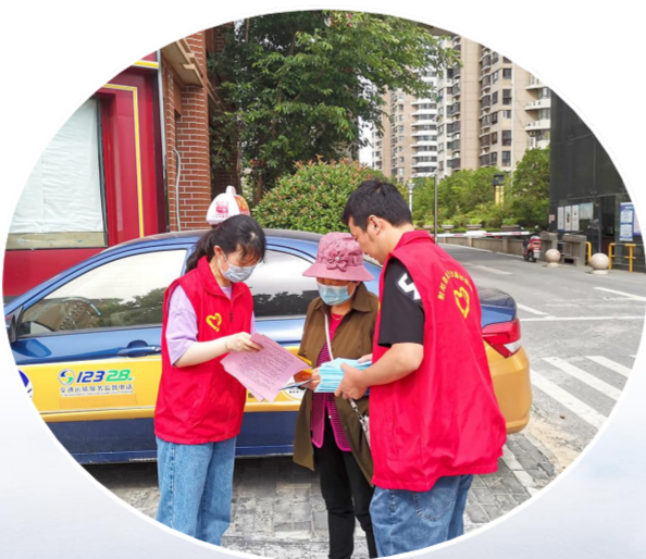
贯彻落实全国打击整治养老诈骗专项行动