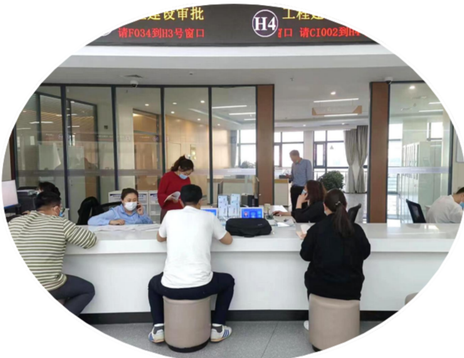
常态化开展重大项目审批帮办代办