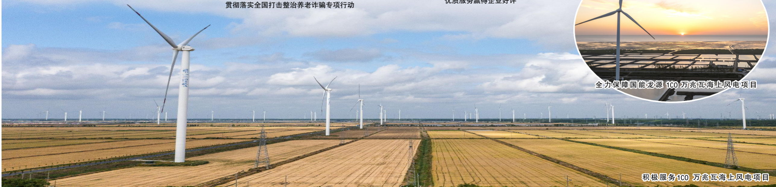
积极服务100兆瓦海上风电项目