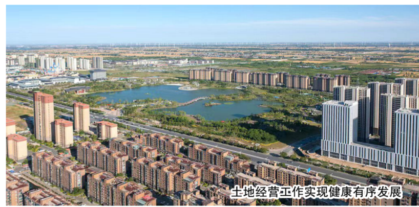
土地经营工作实现健康有序发展

展“我为群众办实事”活动，打造了“阳光登·e证达”党建品牌。提升关联业务“一件事”联动服务效率，常态化开展“交房即发证+水电气网”一件事，实现不动产权证书、证明等8本证书证明在20分钟内一次性办结的“射阳速度”。今年共办理各类登记业务11964件、商品房合同备案1883件；面积测绘备案小区31个(幢)，单位及个人1108宗；接待各类不动产登记查询2万人次。