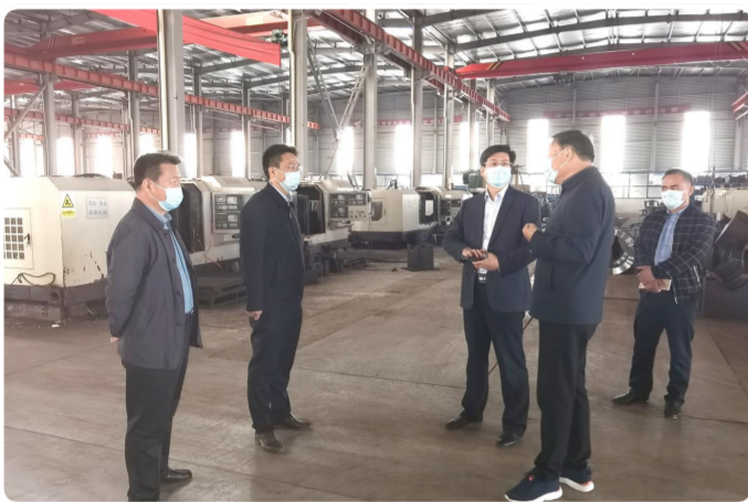
局领导挂钩服务企业