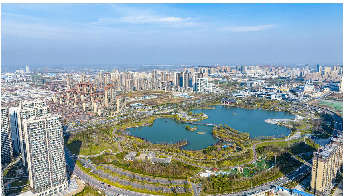
冬季鹤乡

老弟按照我的意思,把这一批下箱的鱼给捞起来,留下几条继续蹦跳的大脚鱼为我们这次淌跳箱的圆满收官立下了垂垂之功。待到天色渐晚,上下游的水位几乎持平,我们才鸣金收兵,那几条不眠不休以吸引鲫鱼成群下箱的大脚鱼被我放了生,至于同类如何处置它们,我就不不得而知了。