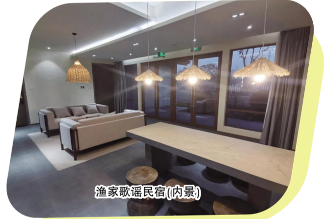
渔家歌谣民宿(内景)