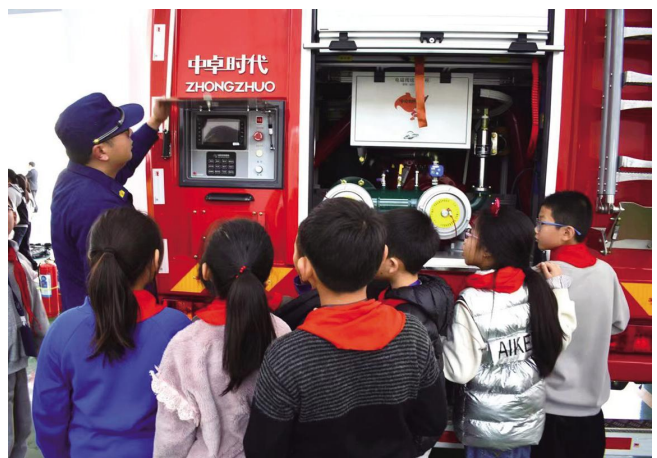
11月8日下午,在第32个全国消防日来临之际,海河镇安委会同海河小学在镇消防队举行“掌握消防知识,提升逃生技能”的主题活动。少先队员们通过聆听消防安全常识宣讲,观看消防科普和火灾事故短片,逃生互动疏散演练,增加了孩子们的消防安全知识和防范意识。

强化巡逻防控,筑牢防控体系。持续开展企业周边治安专项整治,最大限度预防和减少影响企业营商环境发展的各种违法犯罪行为,为企业良性发展提供保障。根据全镇企业的分布情况,划分成网格,结合辖区的治安状况特点,四明镇派出所正常组织警力定人定岗,采取步巡、车巡相结合的方式强化巡逻防控,不断提升街面见警率,织密社会面防控网,坚决清除重点部位治安隐患,全力打击各类违法犯罪,最大限度降低发案率,为全镇企业营造良好的经济发展环境保驾护航。