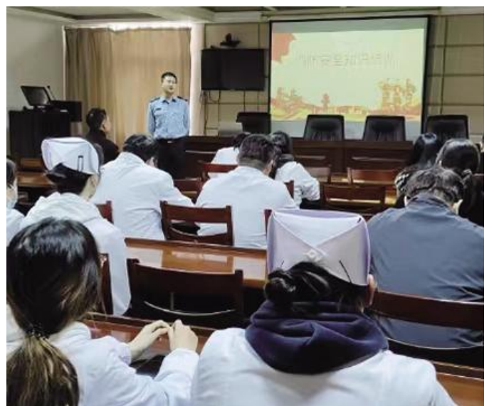
11月9日是全国第32个119全国消防安全宣传教育日,耦耕卫生院积极响应号召,开展消防安全宣传教育、灭火实操培训和消防疏散演练,营造学习消防、参与消防良好氛围。图为消防培训现场。

拧紧“安全阀”。该集团切实加强安全风险控制评估和重大事故隐患排查治理。对县城污水处理提质增效、港城污水处理厂等年度重点工程,明确专职安全员,实施常态监管;对海鲜大卖场、桑乐田园、四季果香等研学业态,抽调集团机关人员,加强旅游旺季安全管控;对衣冠橱厨、汇佳水产和兴华路等三家农贸市场,持续开展人员密集场所消防用电安全、食品安全和燃气安全等专项督查,拧紧“安全阀”,为集团高质量发展筑牢坚固的安全屏障。