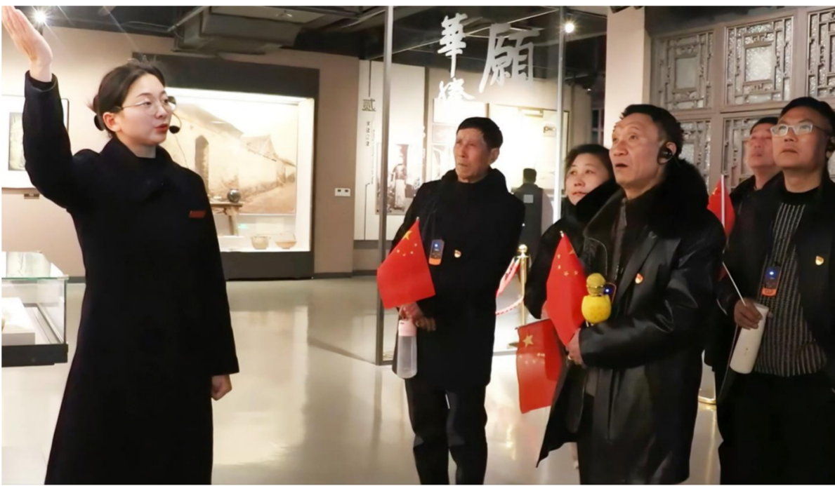
近日,县交通运输局组织党员干部赴周恩来纪念馆参观学习,缅怀革命先辈的丰功伟绩,进一步汲取前行力量,坚定奋斗方向。

让农村强起来、农民富起来,我县投入资金3844.22万元,共实施衔接乡村振兴资金项目8个,构建扶贫项目资产“线上+线下”管理模式,开发乡村公益性岗位,覆盖低收入人口115人。通过整合省、市、县三级乡村振兴帮扶工作队各类帮扶资金共计5000余万元,实施富民强村项目40个。落实“干部联村、一村一策”,提升村集体经济水平,全县231个涉农村(居)集体经营性收入稳定在40万元以上,其中50万元以上205个,100万元以上47个。2023年,农村居民人均可支配收入增幅为7.4%,增长速度高于全省、市平均水平。