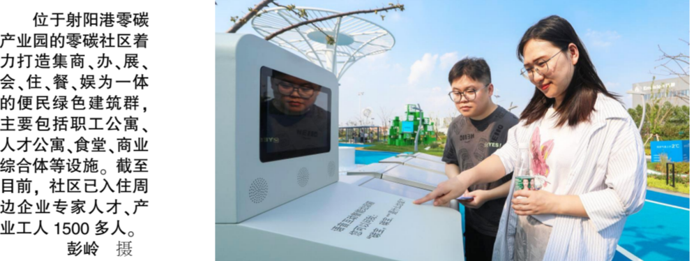
位于射阳港零碳产业园的零碳社区着力打造集商、办、展、会、住、餐、娱为一体的便民绿色建筑群,主要包括职工公寓、人才公寓、食堂、商业综合体等设施。截至目前,社区已入住周边企业专才、产业工人1500多人。