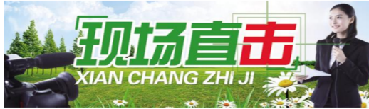
现场直击 XIAN CHANG ZHI JI

国家网络安全宣传周期间,射阳农商银行充分发挥线下营业网点优势,除在营业大厅摆放宣传展板、发放宣传资料、LED屏字幕滚动宣传,大堂经理主动向客户讲解网络安全法律法规、个人信息保护、数据安全、防范网络诈骗等内容,提醒客户在日常生活中注意保护个人隐私,不随意点击不明链接,不轻易泄露个人信息。该行还通过晚间课堂形式,向全行干部职工普及网络安全知识;组织专业团队走上街头,深入社区、学校、机关等场所,通过设立宣传咨询点、发放宣传手册、微信公众号推送科普文章等方式,广泛宣传网络诈骗的常见手段和防范措施,有效增强了广大群众的防范意识和能力。