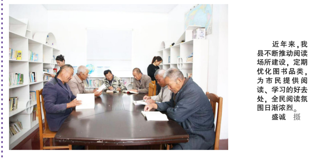
近年来,我县不断推动阅读场所建设,定期优化图书品类,为市民提供阅读、学习的好去处,全民阅读氛围日渐浓厚。