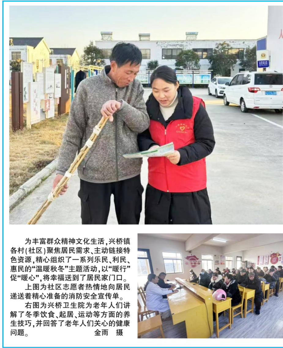
为丰富群众精神文化生活,兴桥镇各村(社区)聚焦居民需求,主动链接特色资源,精心组织了一系列乐民、利民、惠民的“温暖秋冬”主题活动,以“暖行”促“暖心”,将幸福送到了居民家门口。

我县在全县建立“双禁”制度,即全县境内实施禁止非法狩猎的禁猎区、全年实施禁止非法狩猎的禁猎期。该县建立部门联动机制,出台野生动物保护联席会议制度,密切配合,各司其职,协调做好野生动物保护工作。县自然资源和规划局、公安局、自然保护区管理处等部门联合执法,重点打击湿地、自然保护区等区域的非法猎捕、杀害、养殖陆生野生动物及制品的违法行为。组织开展了执法巡查行动67次,其中联合行动9次(夜间行动5次),捣毁非法猎捕野鸭窝25个,拆毁网具100张,没收并救助野生动物15只,没收猎捕工具17件。