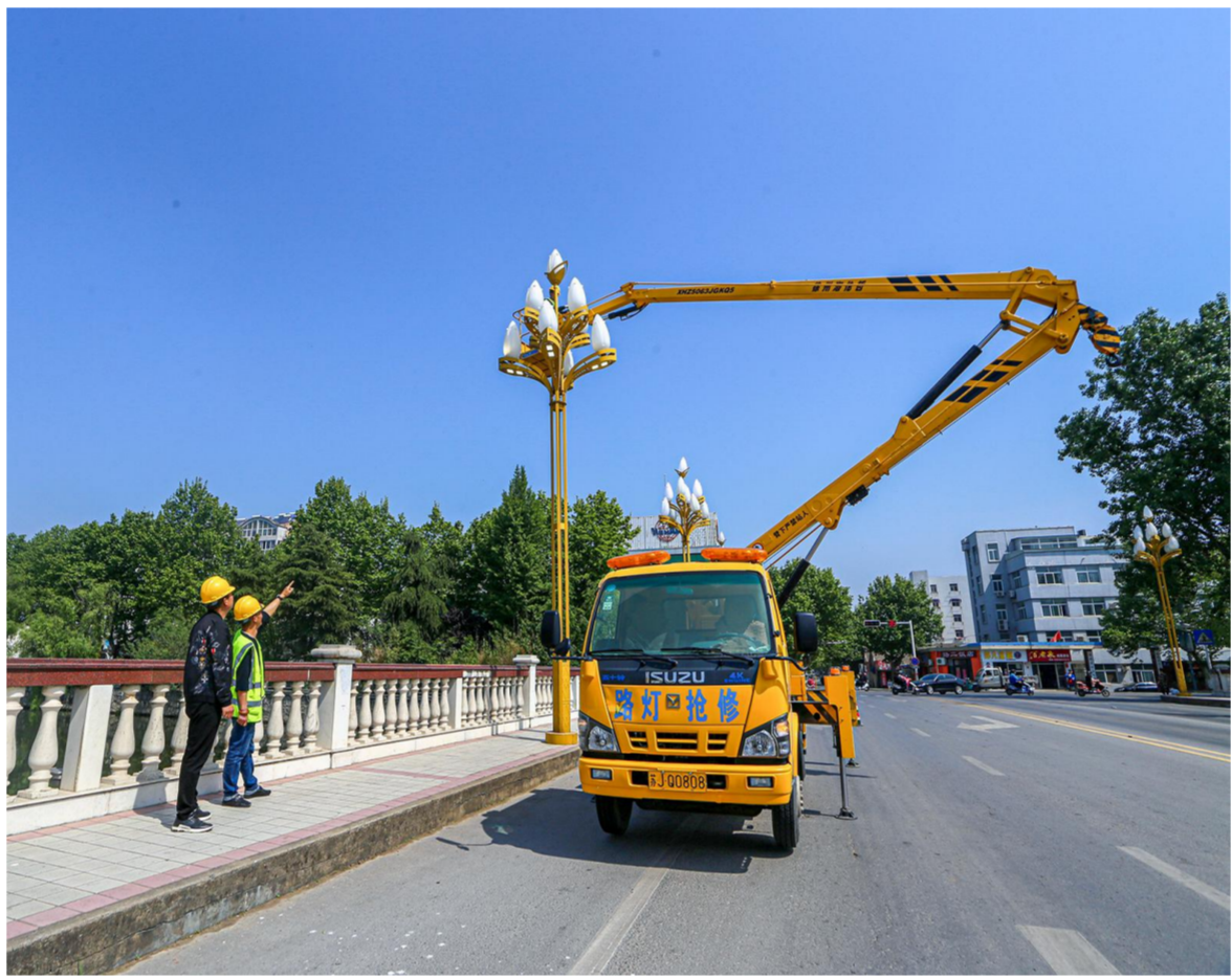
连日来,为保障城市亮化,方便居民出行,城管管理局路灯管理所安排多辆路灯维修车对县城内的路灯进行管护。图为工作人员正在更换受损路灯。

我县渔港实行“港长制”责任管理体系,黄沙港国家中心渔港实行“双港长制”,由县政府分管领导任总港长兼黄沙港国家中心渔港港长,黄沙港镇、临海镇政府主要领导分别任黄沙港渔港和双洋港渔港的港长。