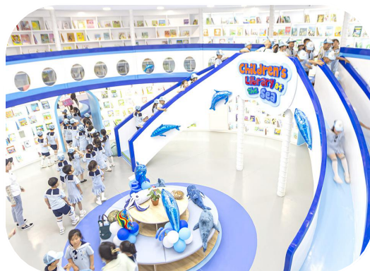
黄沙港海洋童书馆已正式投入运营