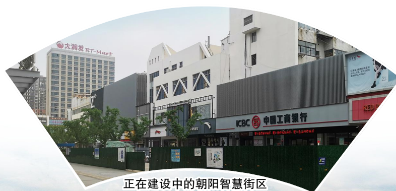
正在建设中的朝阳智慧街区