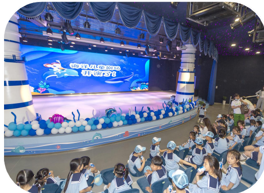
黄沙港儿童剧场已建成对外开放