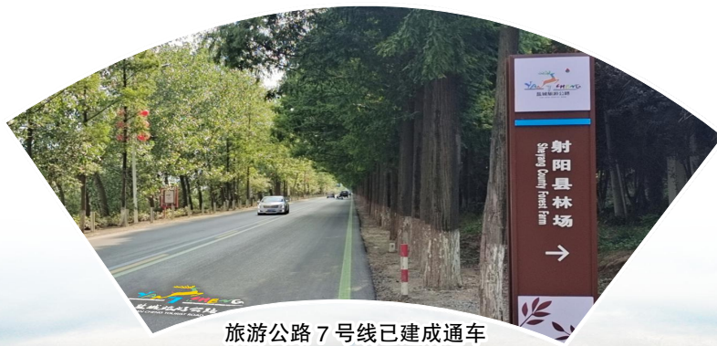
旅游公路7号线已建成通车

不忘初心方能行稳致远,牢记使命才能开辟未来。旅投集团将全面贯彻县委全会的决策部署,以旅游项目开发为重点,以旅游业态运营为突破,锻长板创特色,争先进攀新高,为建设“强富美高”现代化新射阳作出新的更大的贡献!