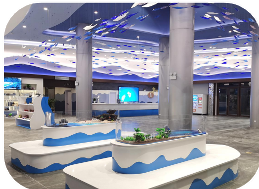
黄沙港泊心广场游客中心