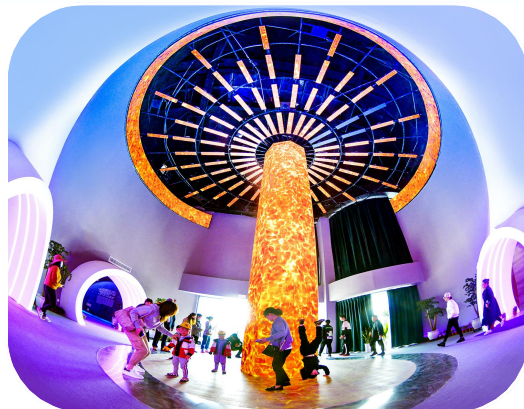
日月畅想主题馆已建成对外开放