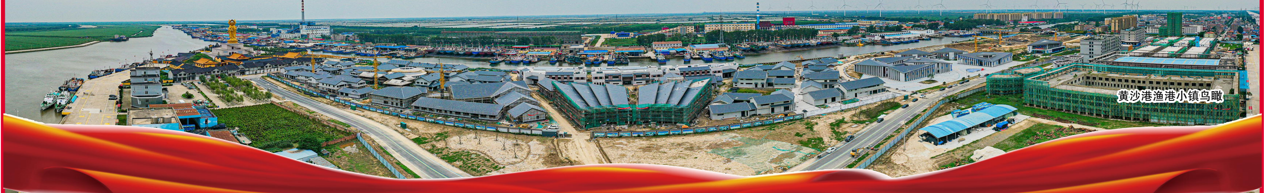
黄沙港渔港小镇鸟瞰