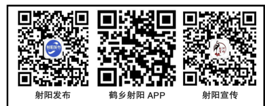
射阳发布 射阳APP 射阳宣传