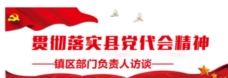
贯彻落实县委党代会精神

二是以一类口岸为动力,打造风电产业装备港。以国家一类开放口岸获批为契机,积极推动盐城港集团高起点规划建设“功能型、国际型、产业型、智慧型、生态型”现代化港口。深度拓展“风电装备产业港”建设内涵,快速推动大件码头岸线报批及工可审查工作,二季度完成项目立项手续及EPC(工程总承包)招标前各项准备工作,三季度开工建设,建设1500亩后方堆场工程,形成布局合理的风电专业化港口。以远景、中车等风电龙头企业为起点,不断延伸,精准掌握客户需求,全年运输风电大件不少于400台(套);