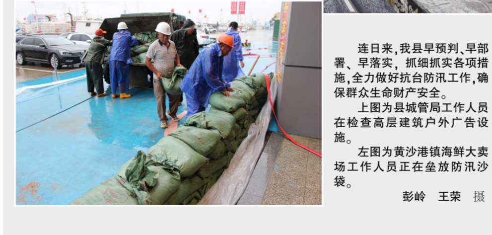
连日来,我县早预判、早部署、早落实,抓细抓实各项措施,全力做好防汛抗汛工作,确保群众生命财产安全。