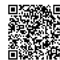
扫码查看 2024秋季招生简章

这次汇演,不仅展现了广电老年大学老年学员的艺术修养,更向所有人传递着奋发向上、乐观生活的正能量。受到学员们的积极影响,不少前来热闹的新朋友也当场报了名,而随着当天线上新生报名通道的开启,转眼间,已经有七个班级售空了!据了解,2024年秋季学期,苏州广电老年大学将进一步焕新升级,除了竹辉校区、星塘校区,还将新增吴中校区,共设有14门科目、33个班级,拥有26位教师实力教学。学员不仅可以参加音视频直播,还可以参加各种文艺演出和主题式行走活动,拓展学习和生活圈。目前,2024年秋季新生报名火热进行中,欢迎大家踊跃报名,让学习为退休生活添彩!