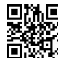
扫码进行 2024秋季新生报名