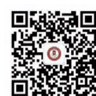
扫码关注 “苏州广电老年大学” 微信公众号