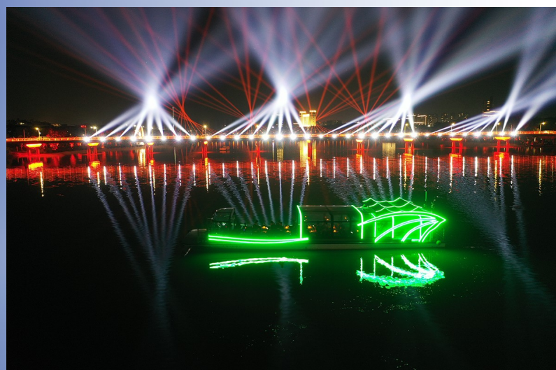
5月1日,始丰湖夜游正式启航。图为游船在始丰溪行驶中。

“五一”假期,始丰湖的夜空璀璨如画。备受瞩目的始丰湖夜游正式启航,不仅点亮了夜经济,也极大提升了城市品位,成为我县文旅发展的标志性项目。夜游主线长3.5公里,沿线表演时间约50分钟。整场夜游以济公为主线人物,聚焦“诗画、山水、佛道、名人”四大文化主题,共分《天台之名天上来》《心声·和鸣》《心愿·和美》等8个篇章。