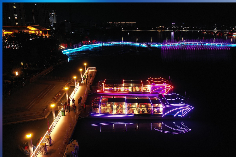
游船停靠码头等待游客登船。