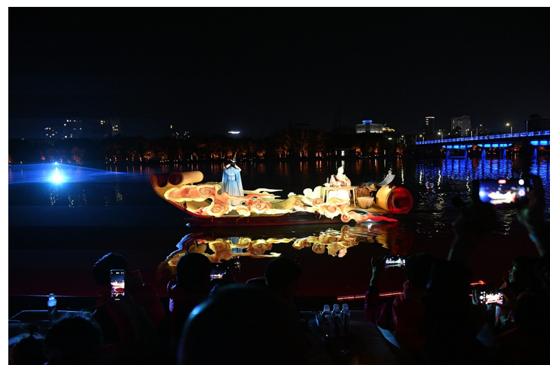
游客坐在游船上观看表演。