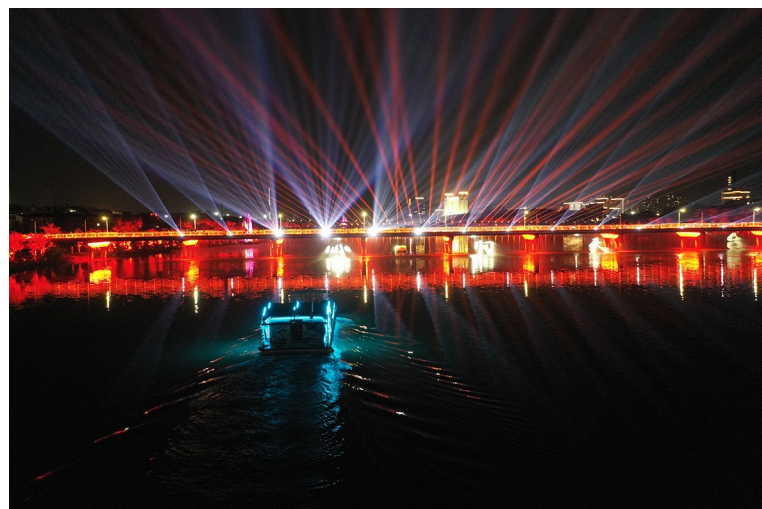
游船在始丰溪行驶中。