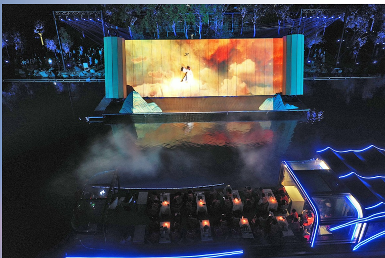
游客坐在游船上观看表演。