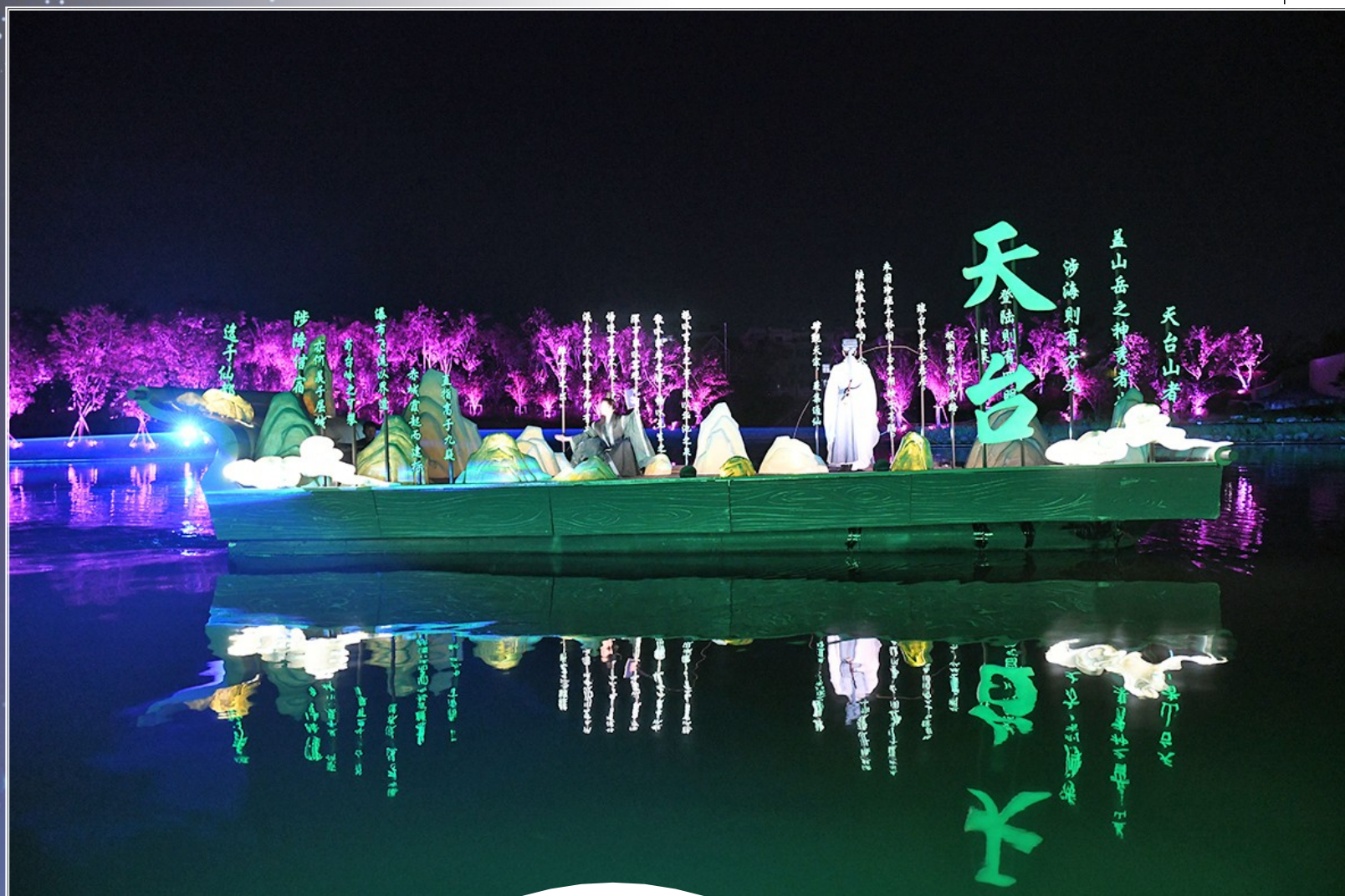
始丰湖夜游沿线表演。