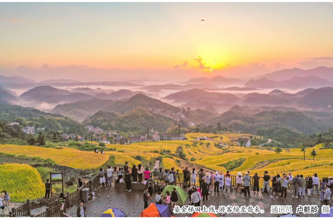
鎏金梯田上线,游客纷至沓来。