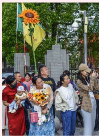
考点外，送考的家长有的穿上美丽的旗袍，有的举着向日葵，为孩子们送上“旗开得胜，一举夺魁”的美好祝愿。

际酒店、维也纳酒店、格雅酒店8个高考考生食宿点。当天上午8点左右，一辆辆送考大巴车满载着高考学子驶向考点。顺利到达后，考生们在工作人员的引导下有序进入考场。