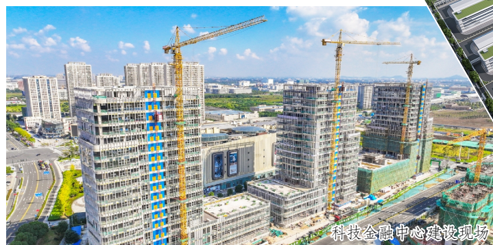
科技金融中心建设现场

“我们郑重承诺，全区各级各部门将以标准‘顶格’、状态‘满格’、服务‘升格’的姿态，把企业当作自家人，把项目当成自家事，真正让企业投资在常经开、满意在常经开、收获在常经开。”在10月9日的重点项目集中签约仪式上，常州经开区党工委书记丁一一说。