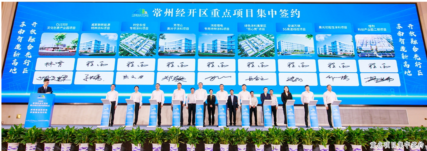
重点项目集中签约

金秋是收获的季节，9月至10月，伴随着2023中国常州科技经贸洽谈会系列活动的举行，常州经开区一批优质项目和基金实现签约，宋剑湖论坛迎来八方来宾，园区更新如火如荼，总部经济蓬勃发展……这片土地上，处处是机遇——