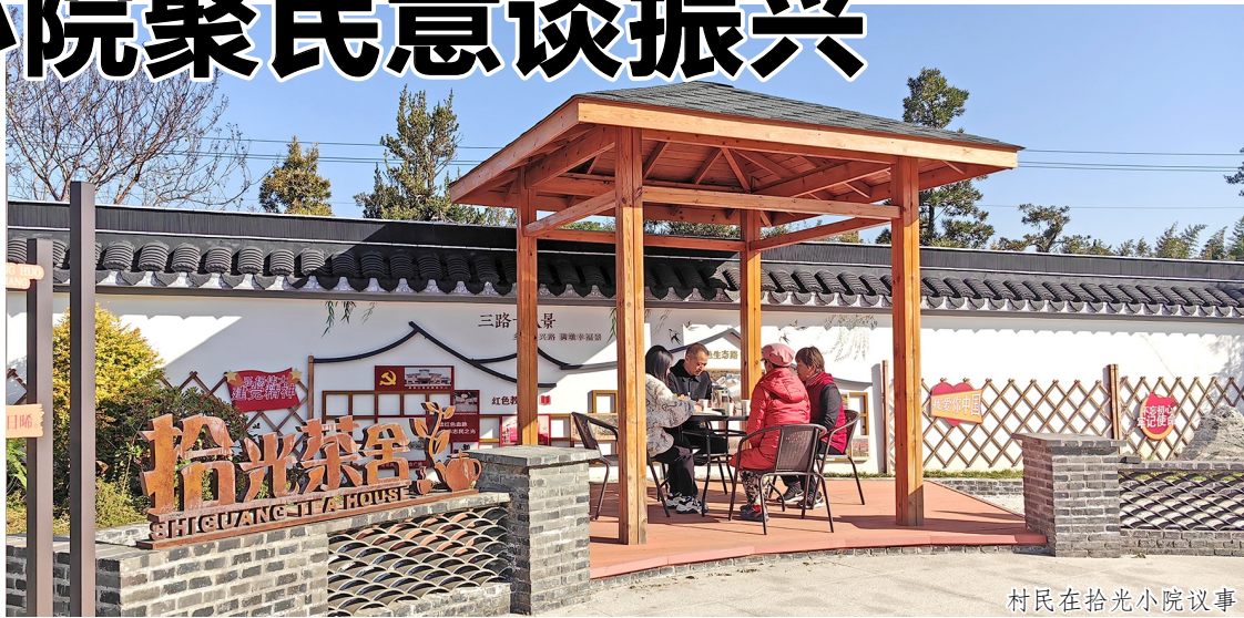
村民在拾光小院议事

“朋友们，今天我们请反诈专家来介绍一些反诈小知识，大家积极互动呀”“接下来为大家带来最新的助农金融产品和资讯，有兴趣的朋友可以了解一下”……11月29日，在嘉泽镇满墩村满天星·拾光小院的一角，“满天星”先锋直播间火热开播。就在不久前，满天星·拾光小院作为我区首个庭院式综合党群服务中心正式开园，聚民意谈振兴，为强村富民开辟了新视野、拓宽了新路径。