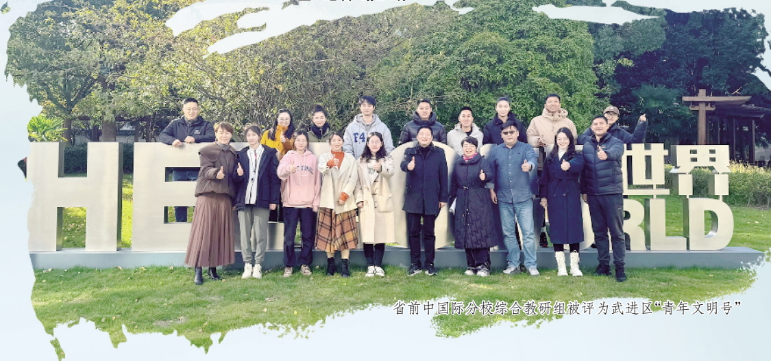
省前中国国际分校综合教研组被评为武进区“青年文明号”