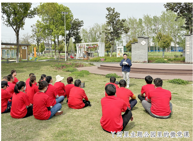
丫河里主题公园里的微党课