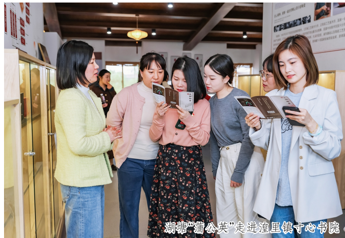
湖塘“蒲公英”走进湟里镇寸心书院

党员冬训，是一场理论学习的盛宴、一次政治品质的锤炼，更是一项筑牢基层战斗堡垒的有力举措。2023—2024年度党员冬训，我区放大“吾常学、吾来讲、吾在行”党员冬训项目品牌效应，紧扣重点主题，贴近基层实际、党员需求，创新形式、丰富内容，紧扣“力量、载体、服务”三大元素，推动党员冬训老课题永葆新活力。