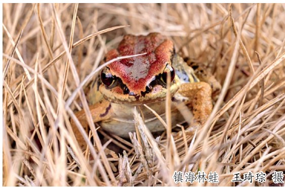
镇海林蛙