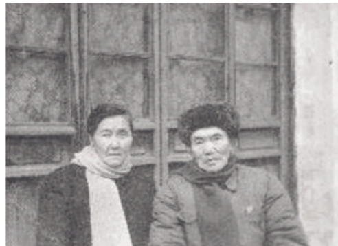
1975年恽逸群夫妇摄于常州

恽逸群从事党的新闻事业多年，有无数突出的建树和辉煌的业绩。73岁高龄的他依然老骥伏枥、壮心不已，在南京第二历史档案馆工作时，制定下撰写《前卅年政事见闻实录》《民国史话》、校勘《辞海》等庞大的写作计划。然而天不遂人愿，1978年12月，恽逸群因病溘然长逝，留下许多未竟心愿，实乃新闻界一大憾事。