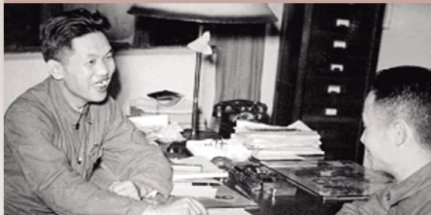
恽逸群(左)在解放日报社办公室与工作人员谈话

1932年，恽逸群投身上海新闻界，开始新闻生涯。此后，他先后主持新华社华中分社、新华日报（华中版）、大众日报、新民主报等共产党新闻机构工作。1949年，他投入《解放日报》的创刊工作，后任该报社社长兼总编。此外，他还兼任华东新闻出版局局长等职。