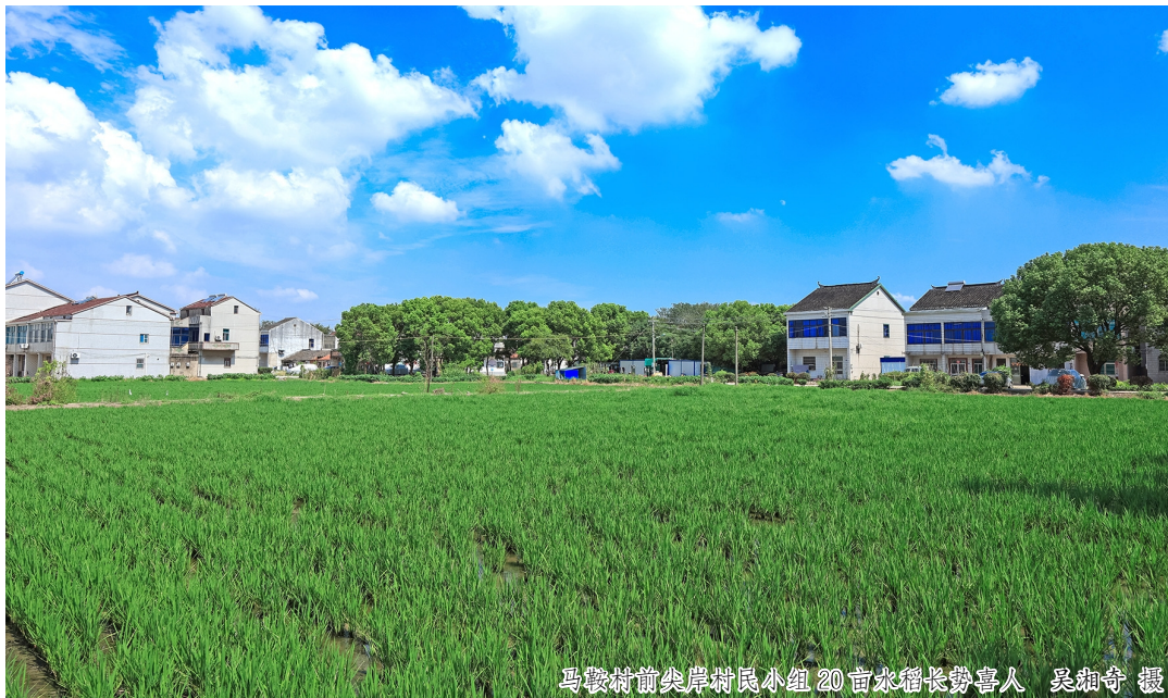
马鞍村前尖岸村民小组20亩水稻长势喜人

为盘活产量低、易抛荒的边角地，两个文明村抱团发展。首先，将马鞍村邓家头、前尖岸等村民小组村民手中的50亩细碎化“小块田”流转下来，通过土地整理、化零为整，变成成方连片的大块田。接下来，这些田地全部被发包给岑村农业有限公司用于优质水稻种植，一举实现规模化、规范化、高效化生产。