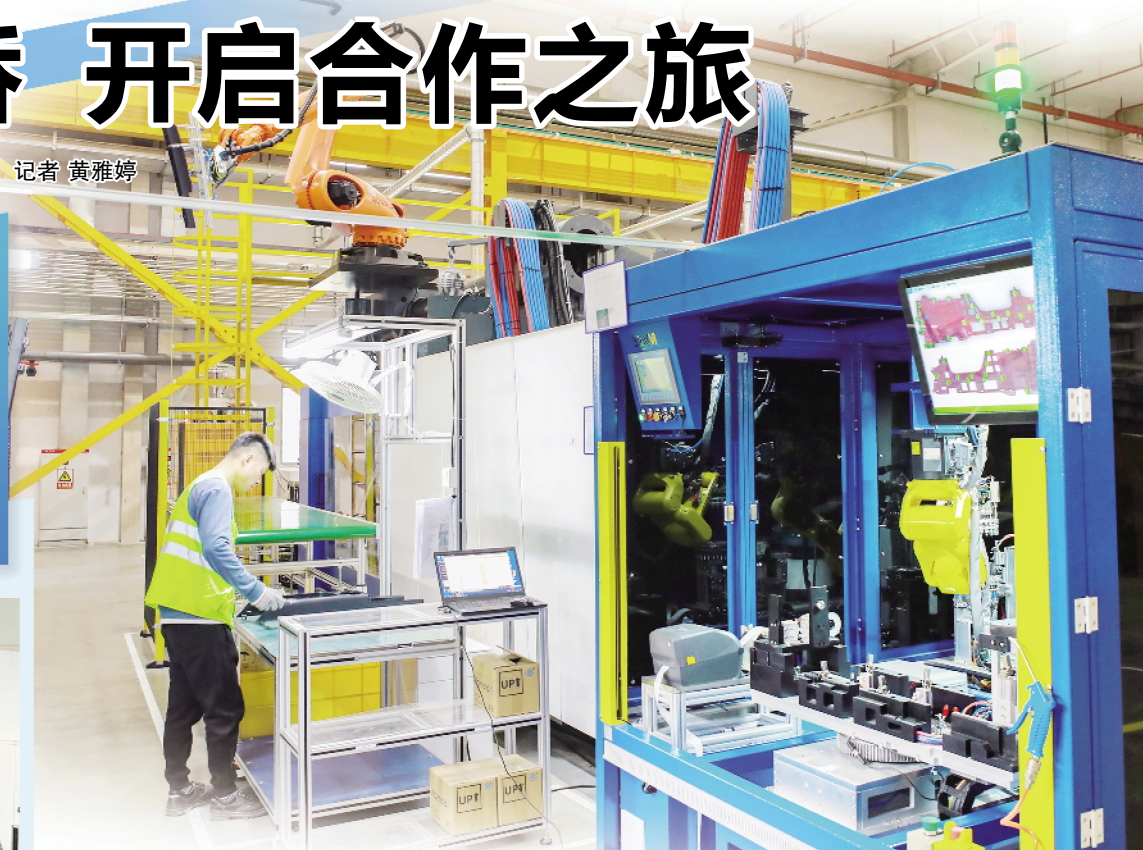
格拉默车辆部件(常州)有限公司