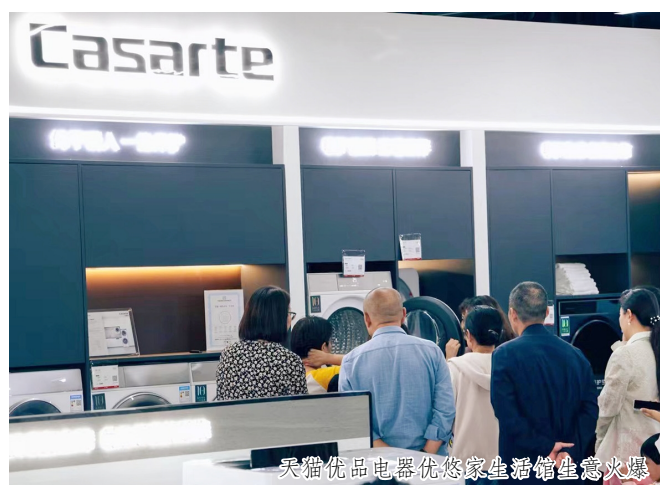
天猫优品电器优悠家生活馆生意火爆