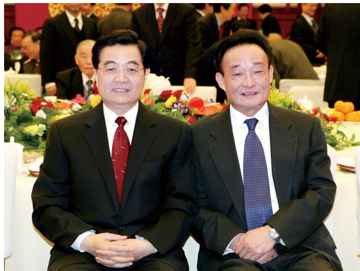
2005年1月1日，全国政协在北京举行新年茶话会。这是胡锦涛同志与吴邦国同志在一起。

一，集中力量建成一批关系全局的重大基础设施，切实增强我国经济发展后劲。他始终情系三峡、关心三峡，对三峡工程质量保障、重大装备国产化、三峡总公司转型发展等进行具体指导，扎实做好移民安置工作，为优质高效建设三峡工程作出突出贡献。他坚持把公路建设放在党和国家事业发展的全局来谋划和推进，明确我国公路发展战略、规划、技术标准和管理体系等重大问题，推动公路建设驶入快速发展轨道。他着力推进铁路建设和发展，坚定支持铁路大提速，推动京九、南昆等铁路全线投入运营，青藏铁路开工建设，开创铁路工作新局面。他大力支持上海洋山深水港立项建设，为打造上海国际航运中心发挥重要作用。他高度重视邮电通信建设，有力推进移动通信网跨越式发展，推动长途光缆线路建设空前快速发展。