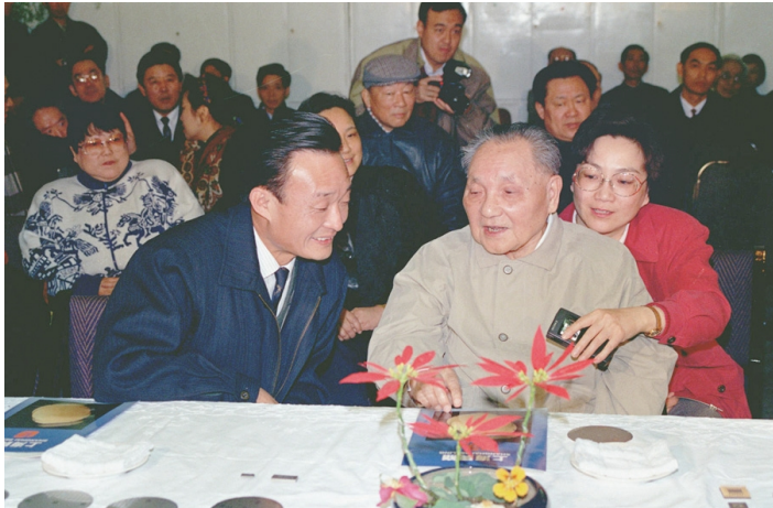
1992年2月10日，邓小平同志在上海贝岭微电子制造有限公司参观时与吴邦国同志交谈。

1991年3月至1994年9月，吴邦国同志任上海市委书记。1992年10月在中共十四届一中全会上当选为中央政治局委员。他积极宣传贯彻邓小平同志南方谈话精神，坚决落实党中央关于开发开放浦东的重大战略决策，牢牢把握上海发展历史机遇，实行城市基础设施建设先行，推动以东带西、东西联动，充分利用国际国内两个市场、两种资源，开创上海对内对外全方位开放新局面。他大力推动经济体制改革，培育完善商品、金融、房地产等市场体系，深化分配制度和社会保障制度改革，加快转变政府管理经济职能，着重抓好转换国有企业经营机制，在全国率先设立国有资产管理委员会。他注重产业结构战略性调整，提出优先发展第三产业、积极调整第二产业、稳定提高第一产业，强调充分发挥科技人才优势，加快发展高新技术产业。他把关系人民群众切身利益的事作为工作重点，筹措建设资金，花大气力推动棚户、简屋、危房改造，改善居民住房条件，集中力量抓好城市道路建设和整治，构建城市立体交通网络，