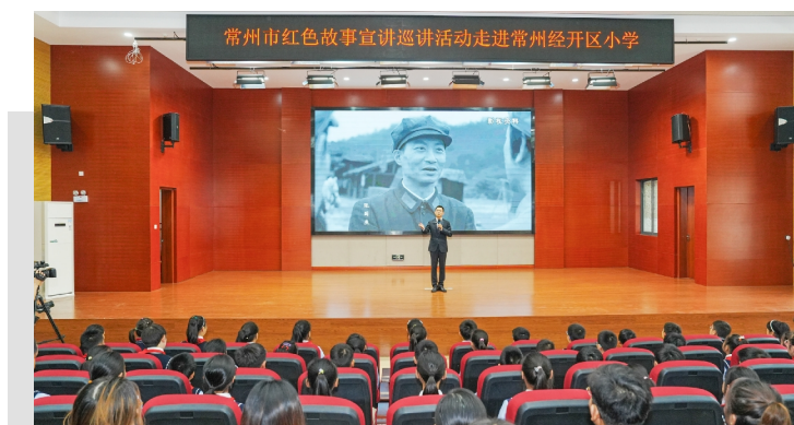
常州市红色故事宣讲巡讲活动走进常州经开区小学

下一步,经开区将加强工作统筹,提前推进明年任务,现已划定12条餐饮场所集中的示范街,目标改造292户,已完成改造220户,持续推动非居民用气场所“瓶改管、气改电”工作顺利进行,全力防范和遏制重特大燃气安全事故发生。