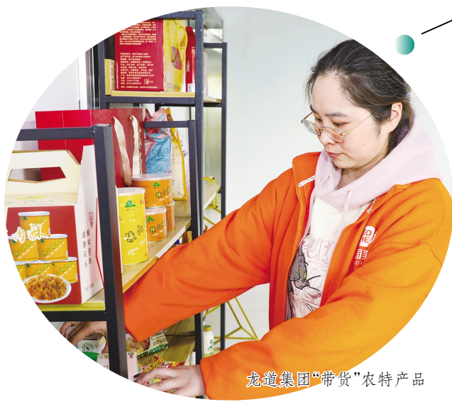
龙道集团“带货”农特产品

多年来，区内多家企业获评省级、市级数字商务企业，示范创建数量位居全市前列。下阶段，区商务局将加快电商产业发展，将其作为撬动经济转型的关键一招，不断培育壮大电商主体，大力发展直播电商等电商新业态新模式，完善产业体系、强化直播人才培训，多措并举激发线上消费潜力，为助推消费扩容升级、增强有效需求动能、推进高质量发展创造新引擎。