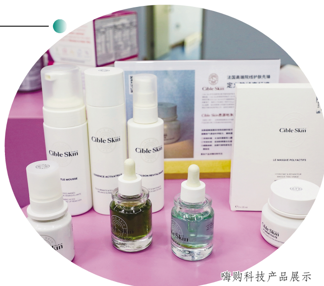
嗨购科技产品展示

成以国家级电子商务示范基地为骨干，以重点电商园区为支撑，以中小型电商“众创”空间为外延的电商集聚发展态势。嗨购科技所在的西太湖电商产业园是国家级电子商务示范基地，基地内集聚了捷成华视网聚、小牛电动等一大批在行业内知名的电商企业。同时，重点电商园区辐射带动周边，科教城、天安数码城等重点电商园区依托专业市场优势，发挥辐射带动作用，促进线上线下融合发展，积极探索传统市场的转型升级之路。