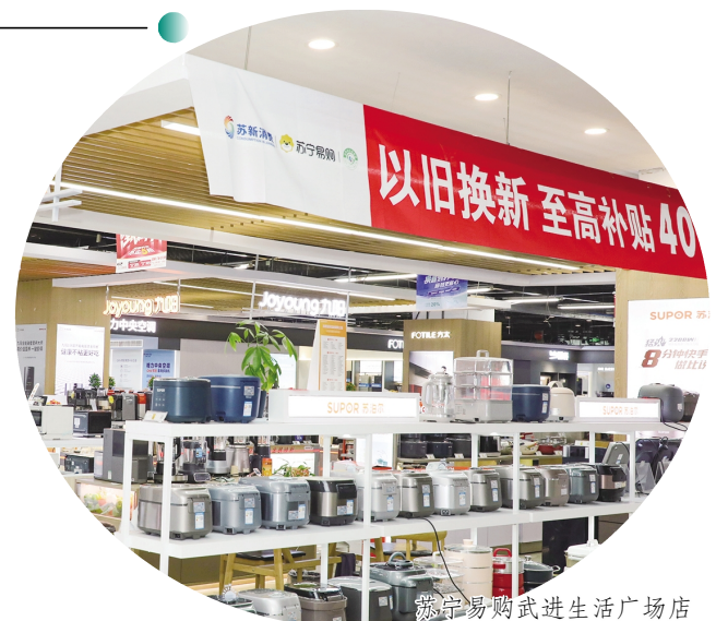
苏宁易购武进生活广场店

“家电以旧换新补贴政策在今年‘双十一’促消费中发挥了重要作用，多重利好刺激进一步增强了市场活力与交易活跃度，扩大了市场消费规模。”区商务局局长董云峰表示，该局将强化线上线下宣传，研究利用好以旧换新等政策，持续刺激消费潜力。