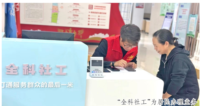
全科社工 打通服务群众的最后一米