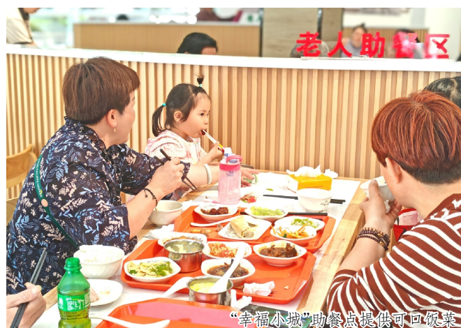
“幸福小城”助餐点提供可回饭菜

北区在不断回应群众需求中,重塑“人与城”的关系,以细心、耐心、巧心下足绣花功夫,把一件件老百姓的“急难愁盼”转化成一桩桩政府为民服务的实事。接下来,北区上下将鼓足干劲、奋发进取,以“满格动力”和“充沛精神”,久久为功、善作善成,让越来越多的“民意”变为“满意”,把民生愿景转为幸福实景。