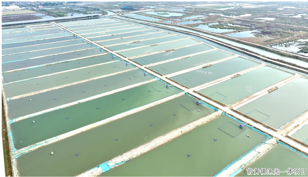
前黄镇渔光一体项目

小小一个“汤块”,加热15分钟就成了一道鲜美可口的佛跳墙。今年,从事预制佛跳墙生产7年的常州丰胜食品科技有限公司搬入武进国家高新区,完成了速冻设备更新、自动化产线布局,并购入高温灭菌设备,实现产品加工标准化、产