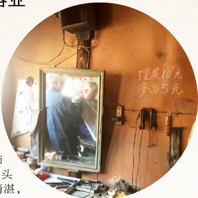
位于遥观塘桥老街的老式剃头店

近。相传，武则天有个儿子叫驴头太子（也有叫“骡头太子”），长得像驴，耳朵大。这位驴头太子曾经在话本小说《薛家将》里出场过，他拥有火尖枪、飞镗和狮子马等法宝，武艺高强，后被樊梨花斩杀。据说驴头太子性格暴虐，对给他剃头的师傅没一个满意的，很多剃头匠因此而死。罗祖手艺精湛，而且非常勇敢，他自告奋勇为驴头太子剃头，挽救了天下剃头匠的命运，从此被尊为行业祖师。