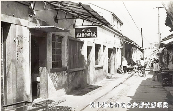
横山桥老街包舍兴南货店照

“广东青豆下仙缸……关东青豆来正好。”如今所谓广东青豆已很难见到，青豆产区主要集中在东北平原、江淮平原、长江三角洲和江汉平原。而东北平原，正是“关东青豆”的产区，现名东北大豆。