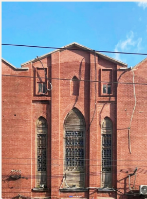
基督复临安息日会沪北会堂

抗战胜利后,四川北路、武进路西北角仍为三民照相馆,直到新中国成立后变更为风雷百货商店。2006年,为配合上海市政建设,这一处房屋被拆除。