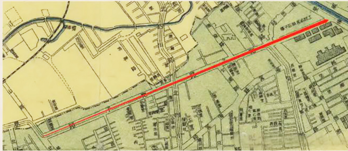
1913年商务印书馆实测上海城厢租界地图(箭头即为武进路)