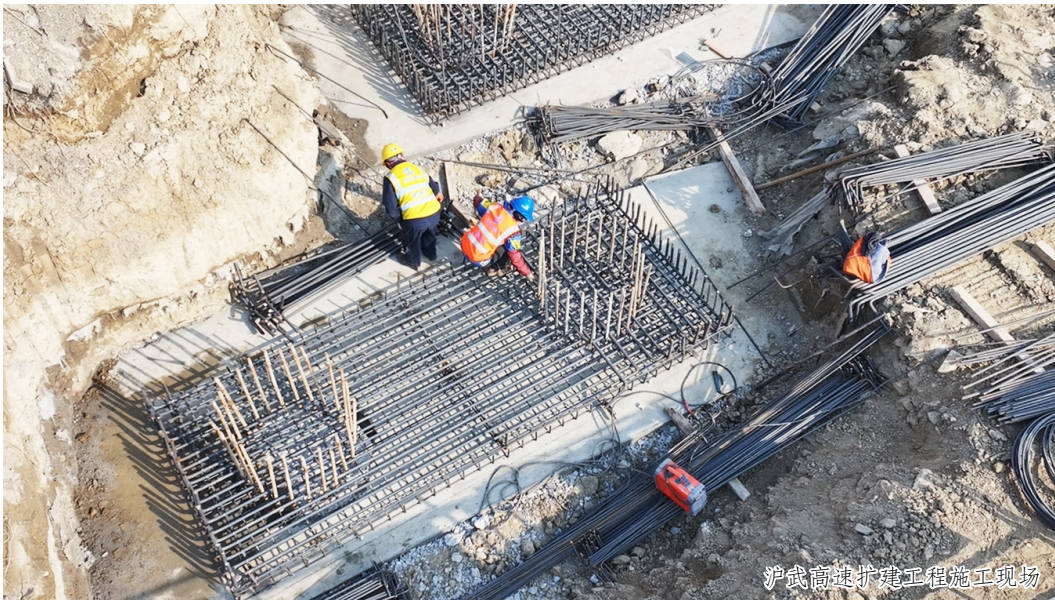
沪武高速扩建工程施工现场

今年，我区将重点推进 2 条高铁、4 条高速和 5 条干线路的建设。具体包括：推动淮泰常铁路先导段开工建设、盐泰锡常