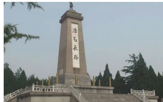
盐阜区抗日阵亡将士纪念塔