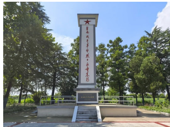
盐南战斗烈士纪念碑