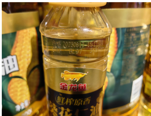
瓶身透明，日期印痕没颜色

食品生产日期、保质期的标签直接关系到消费者的切身利益，不仅涉及到消费者知情权和选择权的保护，也涉及到消费者生命健康安全权的保护。近来，“找不着、看不清、看不懂”的商品生产日期再次引发大家的热议。有不少市民也向本报反映，称我县市面部分商品存在相同标签问题，希望记者能去看看。