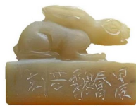
材质:老岢石 尺寸:1.6*4.6*1.4cm 作者:魏小芳 释文:瑞岩庵清晓(白文)