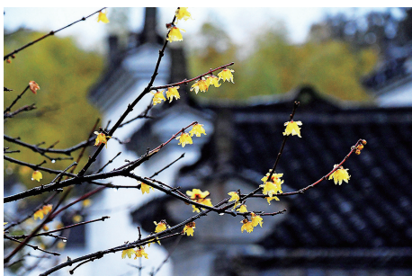
轻雨润梅香