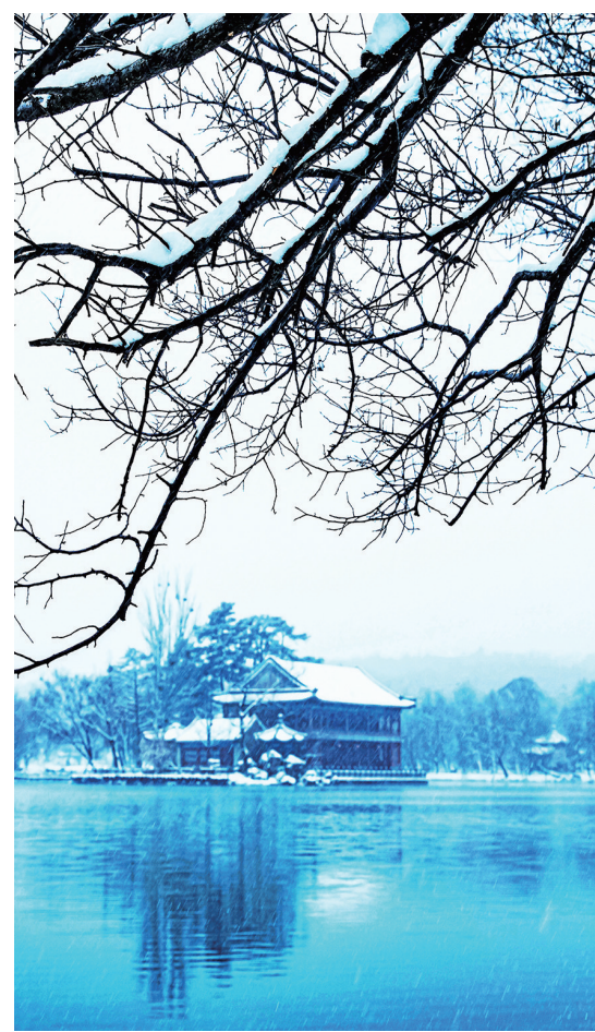
风雪河畔