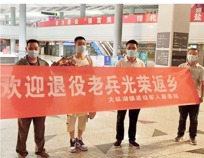
日前,大纵湖镇退役军人服务站、石庄居委会负责人前往高铁站欢迎退伍士兵回家。该镇相关负责人为退役士兵送上鲜花,并致以亲切的问候。