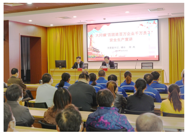
日前,大冈镇举行“百团进百万企业千万员工”安全生产宣讲活动,丝汇报、启程电热、四驾马车等9家企业全体员工参加了活动。王金祥 张兵 高颖 摄

周伟嘉表示,下一步,将继续发挥党与群众的桥梁和纽带作用,积极开展理论宣讲活动,带领村里党员群众学习贯彻党的二十大精神,推动农村精神文明建设开花结果,助力楼王经济社会高质量发展。