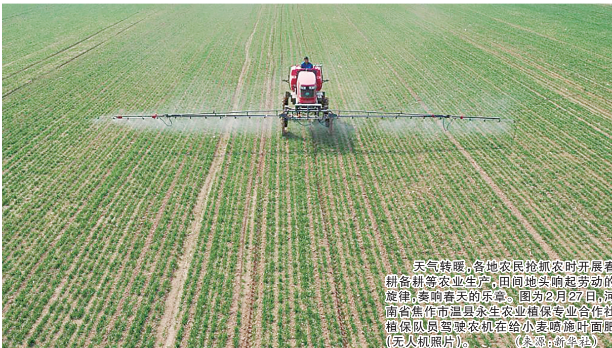
天气转暖,各地农民抢抓农时开展春耕备耕等农业生产,田间地头响起劳动的旋律,奏响春天的乐章。图为2月27日,河南省焦作市温县永生农业植保专业合作社植保队队员驾驶农机在给小麦喷施叶面肥(无人机照片)。

1. 播种(幼苗定植)前施足基肥。蔬菜播种(幼苗定植)前要施足基肥,主要是有机肥和配方专用肥。有机肥施用量一般占作物全生育期总需肥量的30~50%(以氮计),机械深施。配方肥应选用专用配方肥料,对于生育期长的蔬菜,建议选用控释氮的含量及养分释放规律与作物需肥特性相吻合的缓释肥料。对于连作障碍和土传病害严重的土壤,建议施用生物有机肥或生物活性调理剂,以改良土壤理化性状。作物移栽后要及浇水,促进缓苗,切勿大水漫灌。为防止幼苗徒长,前期应适当控制肥水,待茄果类、瓜类蔬菜第一果(瓜)坐住,叶菜类蔬菜的茎叶或产品开始迅速生长或膨大时,再适当增加肥水。