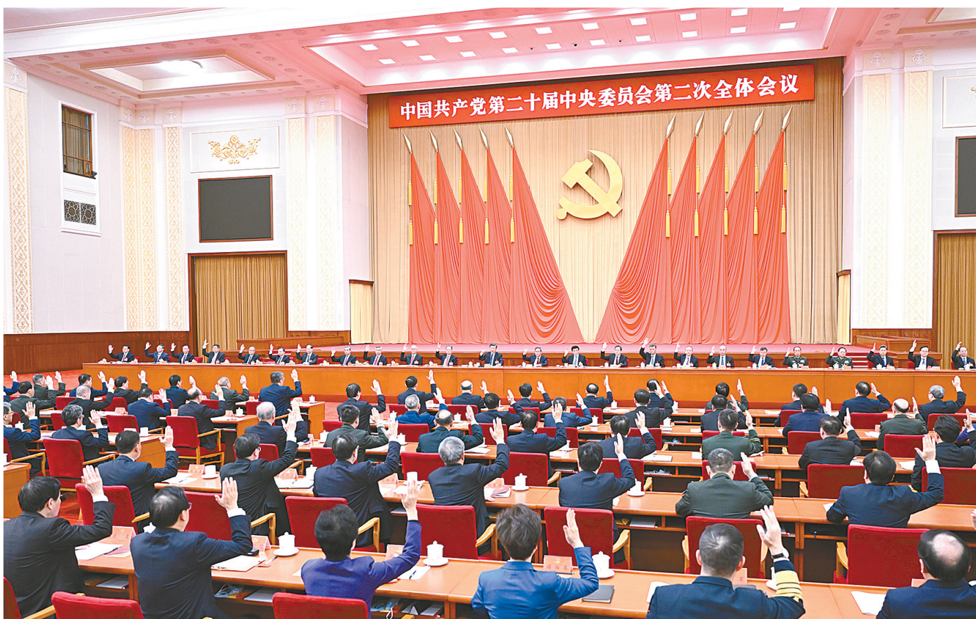
中国共产党第二十届中央委员会第二次全体会议,于2023年2月26日至28日在北京举行。中央政治局主持会议。新华社记者 燕雁 摄

新华社北京2月28日电 中国共产党第二十届中央委员会第二次全体会议公报 (2023年2月28日中国共产党第二十届中央委员会第二次全体会议通过) 中国共产党第二十届中央委员会第二次全体会议,于2023年2月26日至28日在北京举行。出席这次全会的有中央委员203人,候补中央委员170人。中央纪律检查委员会副书记和有关部门负责同志列席会议。全会由中央政治局主持。中央委员会总书记习近平作了重要讲话。全会听取和讨论了习近平受