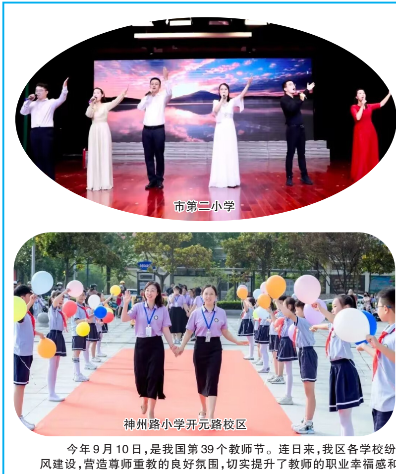
今年9月10日,是我国第39个教师节。连日来,我区各学校纷纷举办教师节庆祝活动,进一步弘扬尊师重教的优良传统,加强师德师风建设,营造尊师重教的良好氛围,切实提升了教师的职业幸福感和使命感。

下一步,盐渎街道将进一步加大检查力度,增加巡查次数,重点查处违规接纳未成年人上网、网吧超时经营、未按规定核对、登记上网消费者有效身份证件等违规行为,以打造一个优质的文化环境,促进全街道网吧行业健康发展。