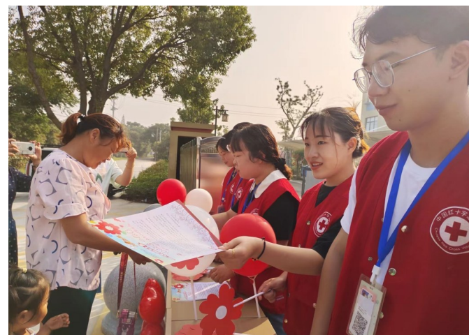
9月7日,龙冈镇红十字会在龙冈桃园幼儿园设点开展“99公益日”线下宣传活动,通过线上扫码和线下捐款相结合的方式,让社会大众了解慈善、参与慈善,在全社会形成人人向善、人人行善、全民慈善的生动局面。截至9月11日,全镇共有1789人捐款,收益达13891.24元。朱俊王耀辉