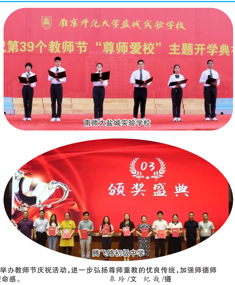
今年9月10日,是我国第39个教师节。连日来,我区各学校纷纷举办教师节庆祝活动,进一步弘扬尊师重教的优良传统,加强师德师风建设,营造尊师重教的良好氛围,切实提升了教师的职业幸福感和使命感。