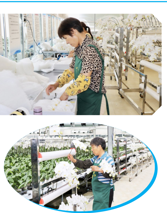
在盐都台创园美青花产业基地温室大棚内,色彩斑斓、姿态万千的蝴蝶兰竞相绽放,散发淡雅的香气。十几名工人正在采摘蝴蝶兰,打包装箱后发往海外,海关工作人员也来到现场帮助办理通关手续。美青花卉是一家台资企业,是盐都台创园重点项目之一,从事蝴蝶兰等兰属花卉种苗繁育、成花出口。年产各种蝴蝶兰鲜切花几十万枝、育苗100多万株。