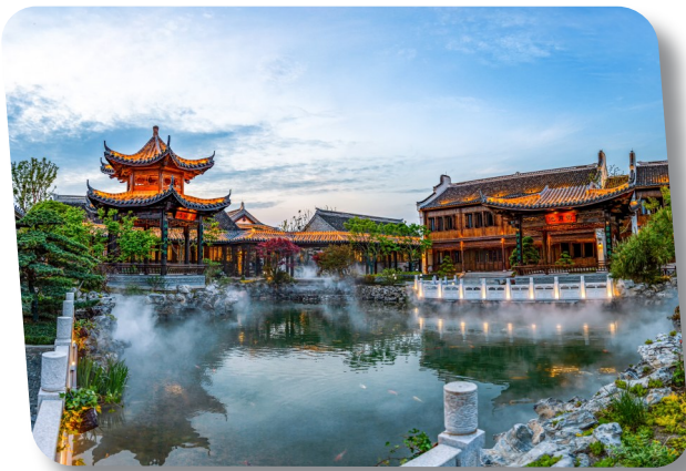
东晋水城开元观堂酒店

今年是新中国成立 75 周年,为深入学习贯彻党的二十届三中全会精神和省市区委全会精神,全面展现 75 年来,特别是党的十八大以来盐都在改革发展过程中取得的新成就、新变化,动员全区各级党组织和广大干部群众在以习近平同志为核心的党中央坚强领导下,统一思想、坚定信心,砥砺前行。“七十五载颂辉煌 阔步迈向新征程”——全媒体新闻行动今天推出第十集《大纵湖旅游度假区:守护绿水青山 书写生态答卷》。