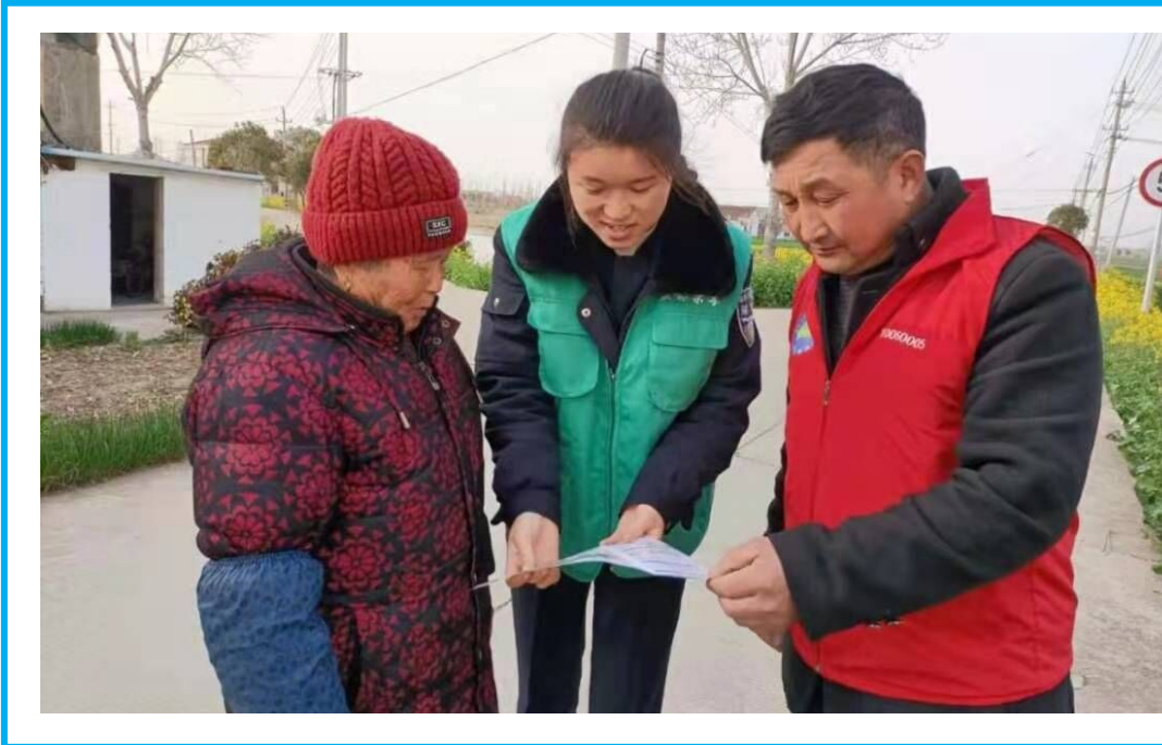
镜走盐都 JING ZOU YAN DU

突出执法监察管护。坚持“源头严防、过程严管、后果严惩”工作理念,依托“季度+年度”全覆盖为主、即时监测为辅的卫片执法工作机制,构建全方位、全天候的执法监管工作网络,逐步做到日常巡查、违法线索、案件查处全过程留痕。加大全民依法用地宣传力度,下发《关于进一步规范全区自然资源管理的通知》。深入推进耕地保护督察问题图斑核查整改,以“零容忍”的态度,对2020年7月3日后发生的新增违法用地,做到发现一起拆除一起。2020年,拆除各类违法建筑物、构筑物18475平方米,恢复耕地151亩,接受了南京督察局土地例行督察的全面检验。