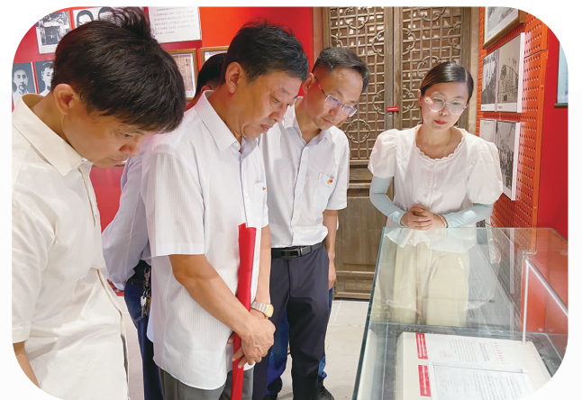
党员干部和群众参观学习。