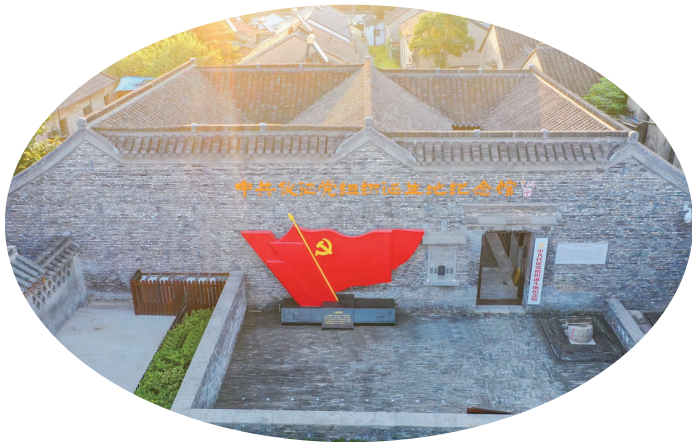
中共仪征党组织诞生地纪念馆。

青砖院落、棕黑木柱、镂空窗棂……去年6月,位于十二圩龙江巷5号的中共仪征党组织诞生地纪念馆完成陈列布展,面向社会开放。这是一座新的纪念馆,也是一座有年头的历史建筑,利用隐藏在古镇的义和泰钱庄,即三行办事处旧址修复改建,占地面积300平方米,集党史学习教育、党史资料查询于一体。