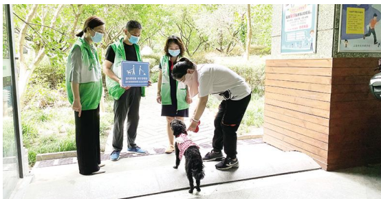
■ 清峪社区开展“文明养宠”劝导志愿服务行动