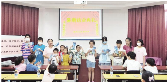
■ 栅桥社区举办社区暑期班结业典礼