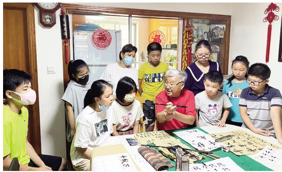
■ 丰一社区开展青少年书法基础培训课