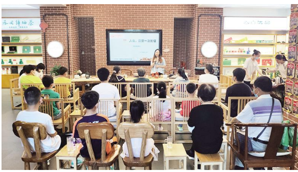
■ 虬江社区组织青少年开展“重走长征路”主题教育活动